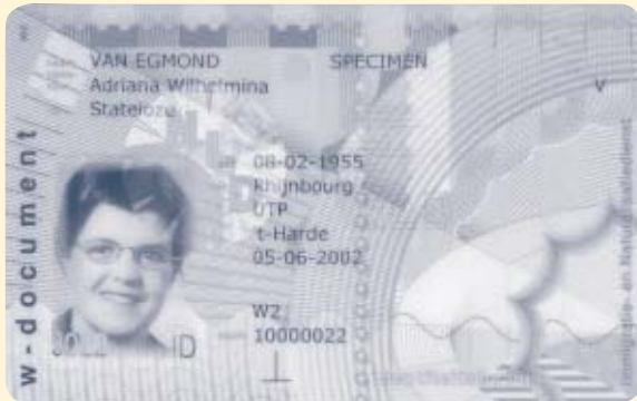
Voorbeeld van het W2-document

Het probleem dat deze vreemdelingen ondervonden werd uiteindelijk op de politieke agenda gezet. De oplossing werd gevonden in de introductie van een speciaal voor deze groepen vreemdelingen in het leven groepen document: het W2-document. Met dit document kunnen zij hun identiteit en nationaliteit aantonen. Ook de verblijfsrechtelijke positie kan ermee worden aangetoond. Dit gebeurt via een aan het document gekoppelde verblijfssticker.