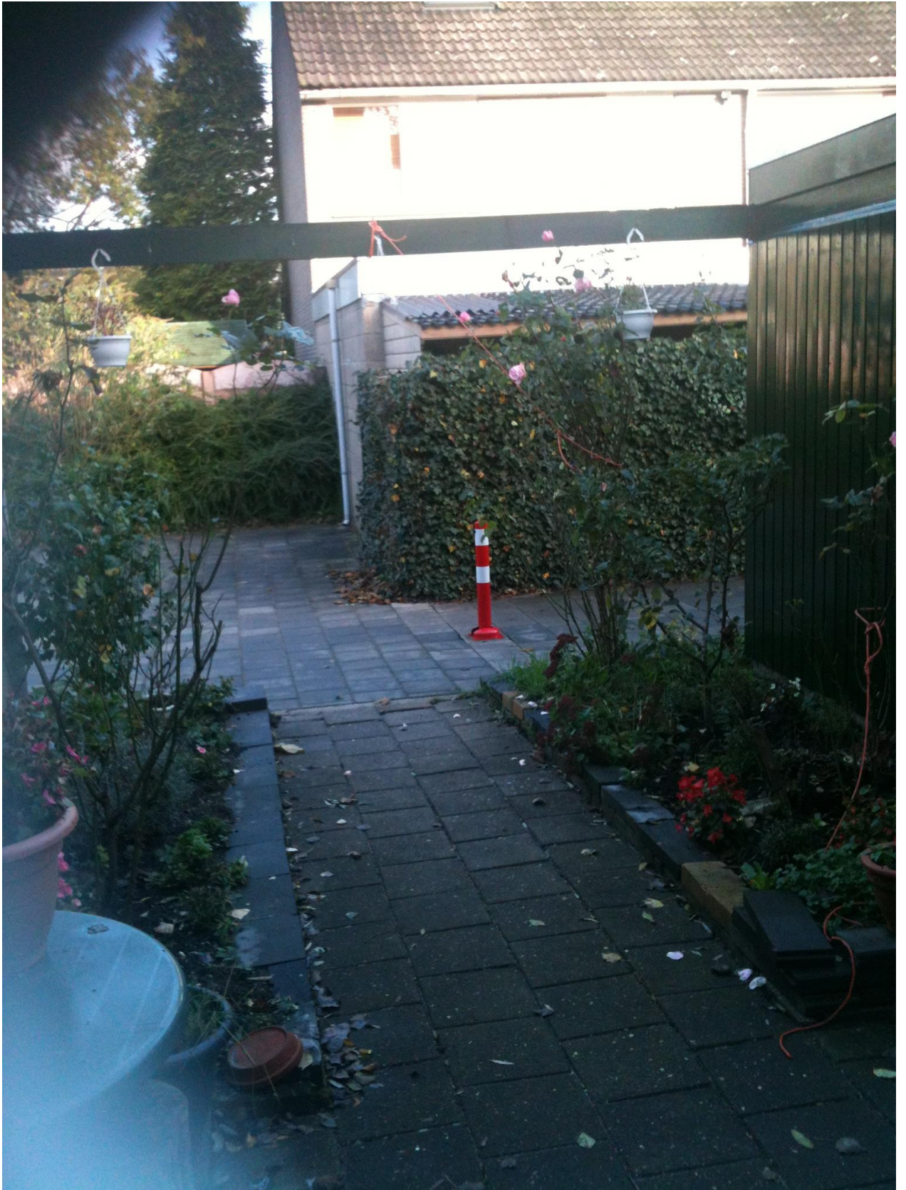
paaltje gezien vanuit verzoekster woning